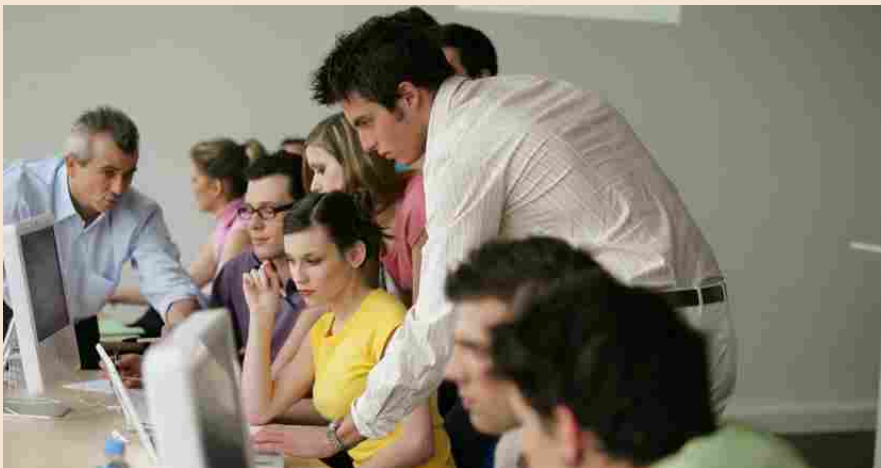
Welfare, innovazione, industria 4.0: 500 milioni per il training on the job